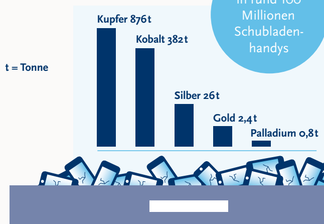
Rohstoffe in deutschen Schubladenhandys

nutzt werden kann und unter Umständen sogar illegal in den Hausmüll geworfen wird. Dabei können nicht mehr benötigte Mobiltelefone zurückgegeben werden, damit sie weiterverwendet oder fach- und umweltgerecht entsorgt werden.